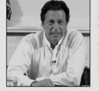
पीपुल्स पार्टी (पीपीपी) और पीएमएल-एन और कई अन्य छोटे दलों ने इमरान खान के खिलाफ यह गठबंधन बनाया है।

इस्लामाबाद। पाकिस्तान का प्रधानमंत्री बनने की राह में इमरान खान को दो बड़े सियासी दलों ने चुनौती देने की तैयारी कर ली है।